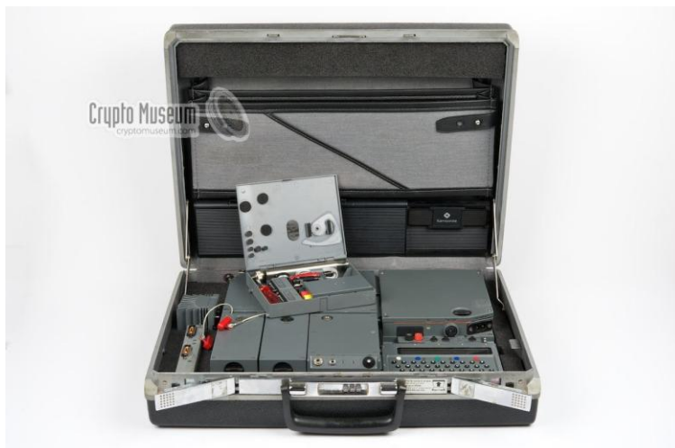
Afbeelding: AZO apparatuur

Deze apparatuur maakte het mogelijk dat iemand die een toetsenbord van een computer kon bedienen, na uiteraard de nodige instructie, met een dergelijk apparaat overweg kon. Het langdurig oefenen met morse werd overbodig. De taken van operator en organisator konden worden gecombineerd, ze werden tot single agent gevormd.