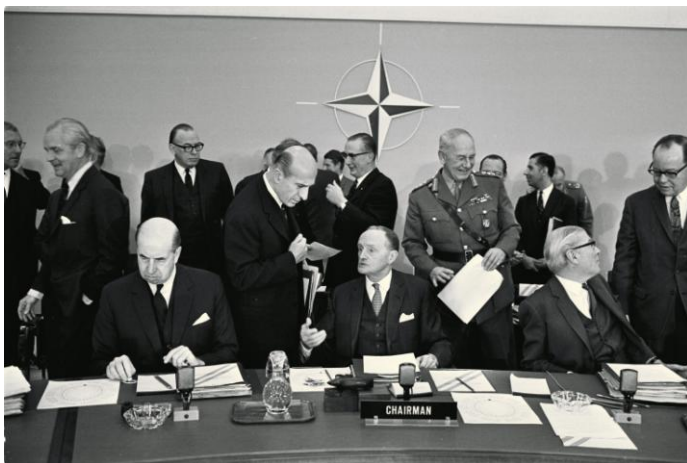
Afbeelding: NAVO vergadering 1949

Amerikanen overhalen om zich erbij aan te sluiten. 71 Het resultaat van de inspanningen was de realisatie in 1949 van de Noord-Atlantische Verdragsorganisatie (NAVO), een militair verdrag dat wederzijdse verdediging en samenwerking van westerse legers regelt. Een aanval (van de Sovjets) op één wordt beschouwd als een aanval op allen. De Verenigde Staten waren een belangrijk lid van de NAVO.