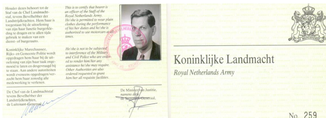
Afbeelding: "de groene pas"

De stafmedewerkers reisden over grote afstanden door heel Nederland naar bijeenkomsten met collega's of agenten, vaak met oefenmateriaal en uitrusting, per openbaar vervoer of bij nacht en ontij met eigen vervoer. Voor eventuele rugdekking bij calamiteiten, bijvoorbeeld een aanrijding of een politiecontrole, beschikte de medewerker over een speciale pas met pasfoto, "de groene pas".