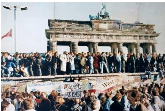
Afbeelding: val Berlijnse muur

'Men kan bewondering hebben voor de veldmedewerkers, de tientallen mannen en vrouwen die -soms jarenlang- belangeloos hun tijd en energie daartoe hebben ingezet. Bewondering ook voor het feit dat men, staven en veldmedewerkers, in staat is geweest de organisatie zo lang geheim te houden.' 68