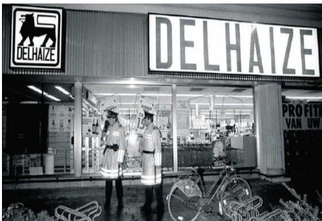
Afbeelding: “De bende van Nijvel” aanslag in België 1985

In 1985 schoot in België, een gewapende bende “De Bende van Nijvel” in Brabantse supermarkten 28 winkelende burgers neer, velen raakten gewond. Onderzoekers leggen een link naar de Belgische organisatie die onder de naam SDRA8 opereerde. Ook het Amerikaanse Defence Intelligence Agency zou erbij betrokken zijn.